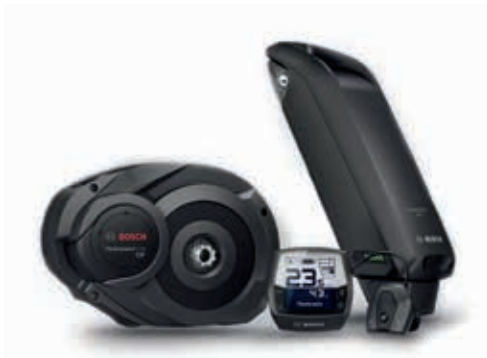
Antrieb Performance Line CX