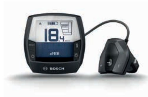
Display Bosch Intuvia