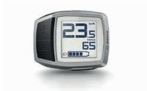
Display Bosch Purion

Der 2-in-1 Bordcomputer Purion bietet viele erstklassige Highlights. Das übersichtliche Display konzentriert sich auf das Wesentliche und bleibt dank Beleuchtung immer gut lesbar. Per Daumendruck ist es leicht bedienbar und zeigt Informationen wie Reichweite oder Ladezustand. In beiden Display-Varianten kann zwischen den Bosch-Fahrmodi Turbo, Sport, Tour, Eco und Off gewählt werden.