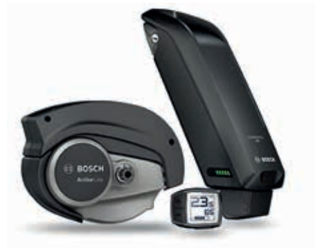
Antrieb GEN3 Active Line